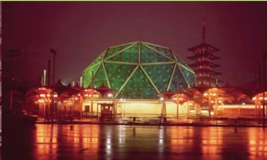
2. みどり館夜景,1970年