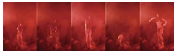
5. 「誕生」上映フィルム部分

[日時]2020年2月22日(土)15:00~17:30 [場所]高島屋史料館TOKYO 5階旧貴賓室 [定員]30名/先着順(要事前予約/HPにて予約受付) [参加費]1,000円(税込)