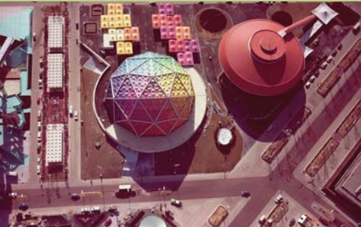
1. みどり館俯瞰,1970年

1970年の大阪万博を紹介する本展では、高島屋がみどり会として共同出展したパビリオン「みどり館」に焦点をあてます。エントランスホールでは吉原治良監修による具体美術展が開催。館内には、全天周映画の鑑賞体験ができる「アストロラマ」(アストロ「天体」とドラマ「劇」を合わせた造語)がありました。放映された映画は、当時珍しかった海外取材や水中撮影なども豊富に取り入れられ、脚本を谷川俊太郎、音楽を黛敏郎、そこに舞踏家土方巽が登場するという、非常に前衛的なものでした。このたびは、パビリオン「みどり館」のメイキング映像とともに、放映された映画「誕生」の一部再現映像を展示します。