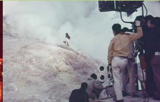
3. 『アストロラマを創る』1970,記録映像より

【関連イベント】 ※全てに事前予約が必要です。予約は右記HPから受付けています。 https://www.takashimaya.co.jp/shiryokan/tokyo